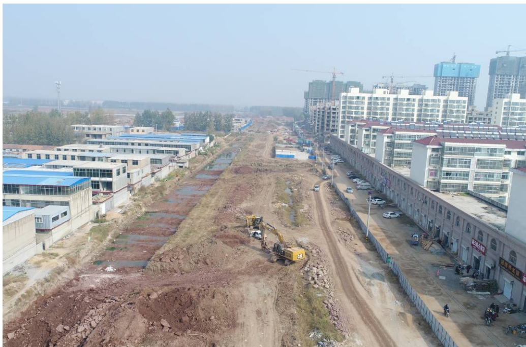
10月30日进展情况 正在进行管廊开挖，基础施工。