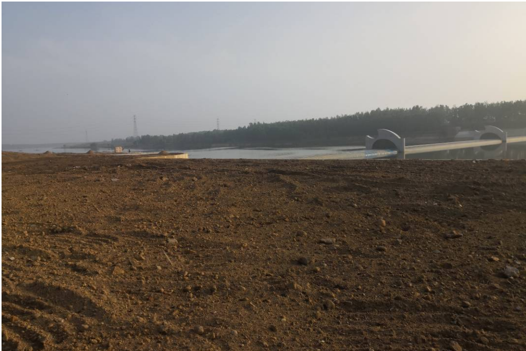
9月25日进展情况 主体、泵房等工程已完工。