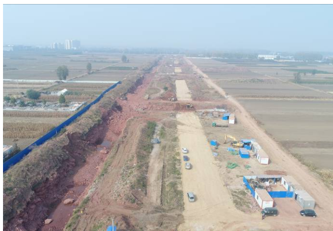
( 青云山路以西段 )