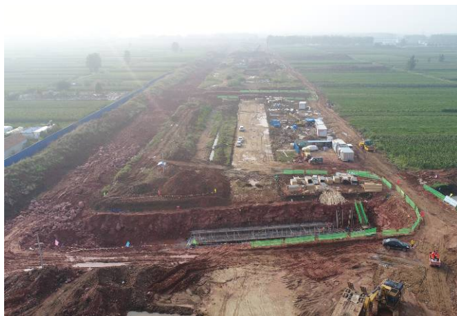
( 青云山路以西段 )