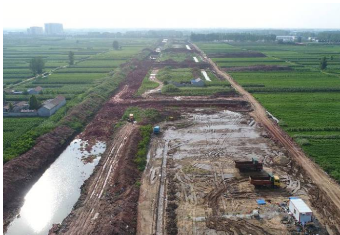
( 青云山路以西段 )