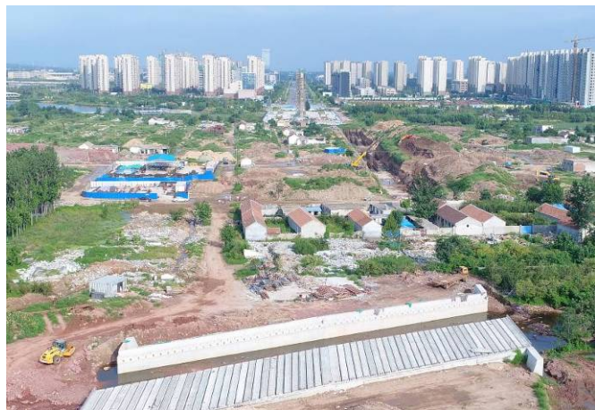
( 青云山路以东段 )