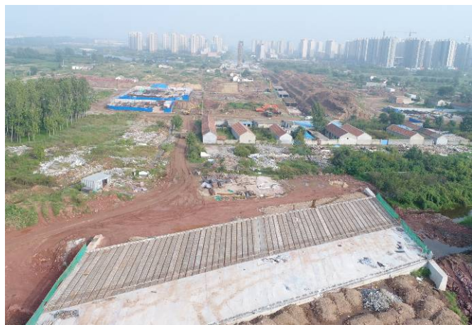
( 青云山路以东段 )