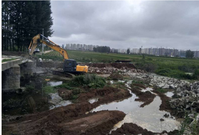
7月7日进展情况（拆除陡沟桥）