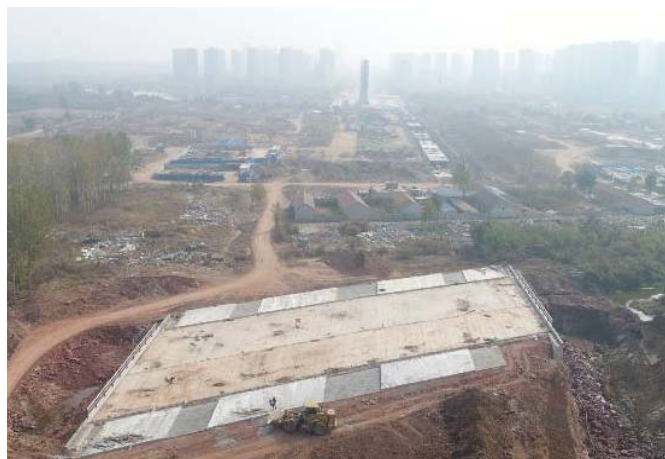
( 青云山路以东段 )