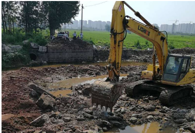
7月20日进展情况（新陡沟桥基础开挖）