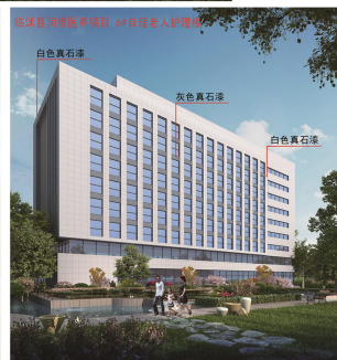
临沭县润德医养项目鸟瞰图