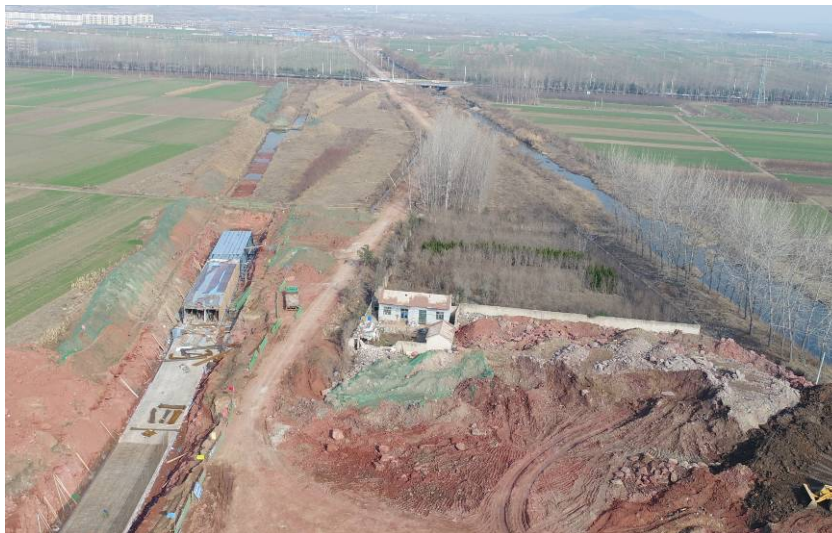
(正大街以北段主管廊正在进行浇筑、支模等施工)