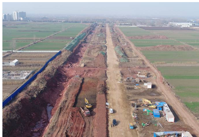
( 青云山路以西段 )