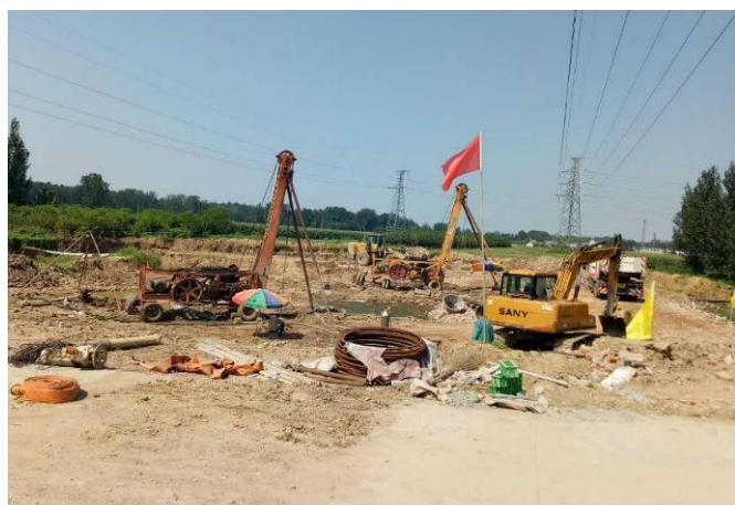
(牛腿沟桥开始基础施工) 8月21日进展情况