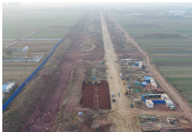
( 青云山路以西段 )