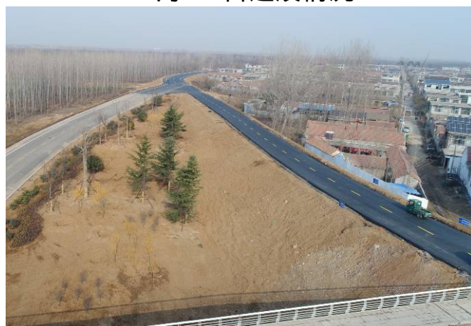
12月24日（沙窝大桥北侧）