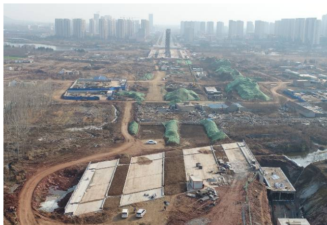
( 青云山路以东段 )