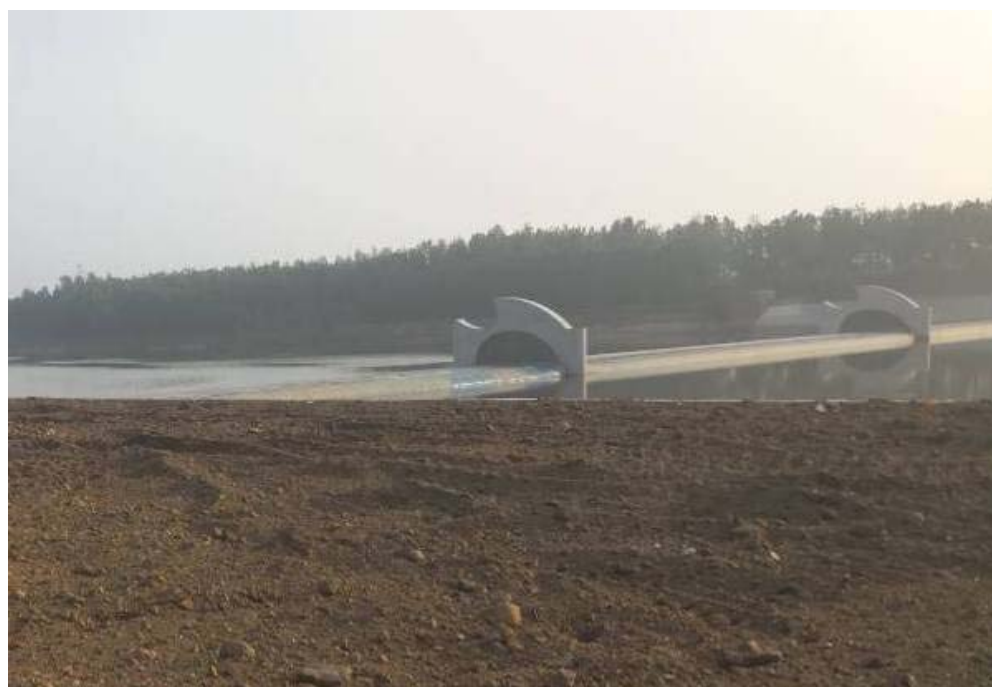
9月主体、泵房等工程已完工。