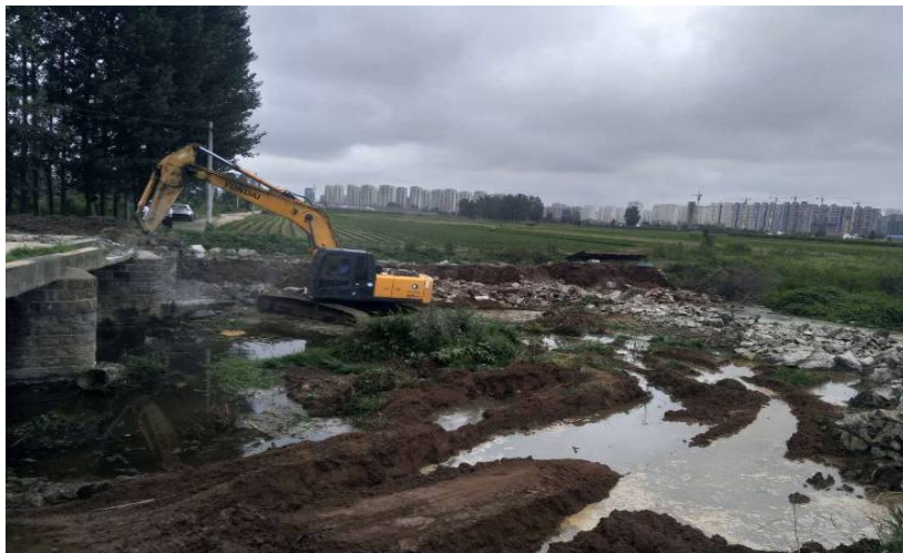
7月7日进展情况（拆除陡沟桥后，建设主体变更）