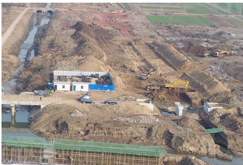
12月24日进展情况（城东一路夏庄河橡胶坝）

施工单位于12月14日进场施工，森林公园提升泵站、夏庄河橡胶坝、半路河3处施工场地正在作业。