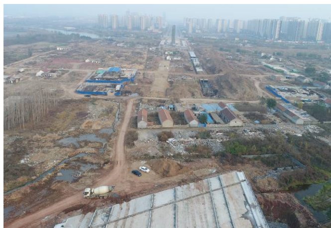
( 青云山路以东段 )