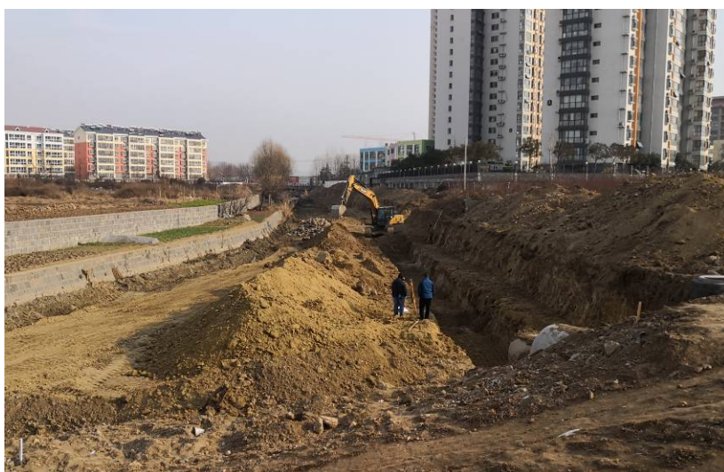
（半路河清淤和污水管道铺设）