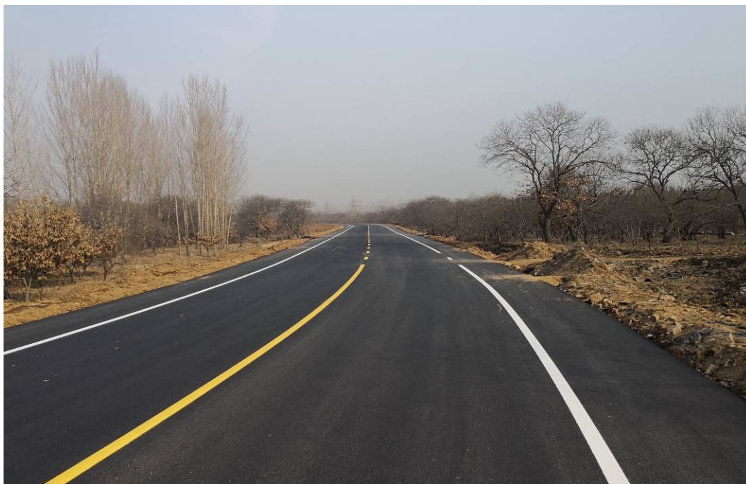
12月24日（沙窝村北，近景）