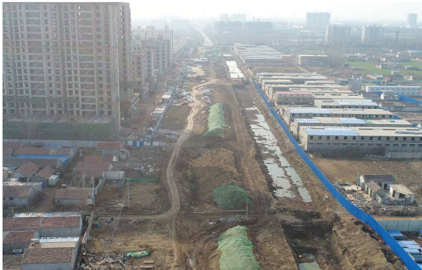
(正大街以南段主管廊正在挖运石方)