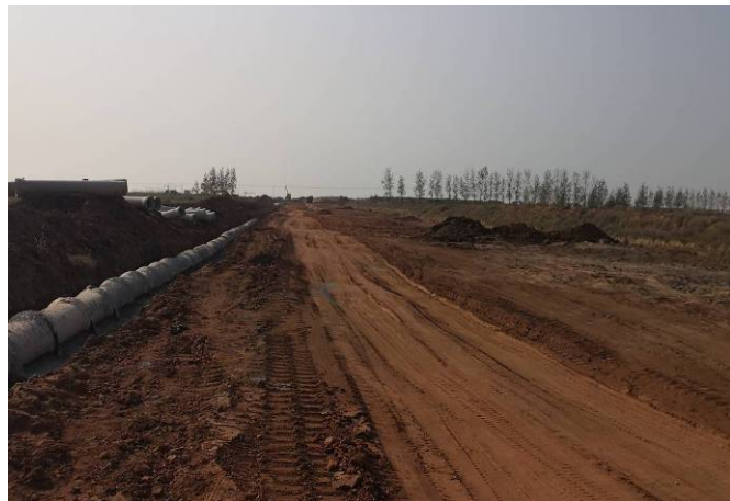
(雨污水管道开挖，路面平整)