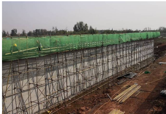
(苍源河中桥桥墩施工)